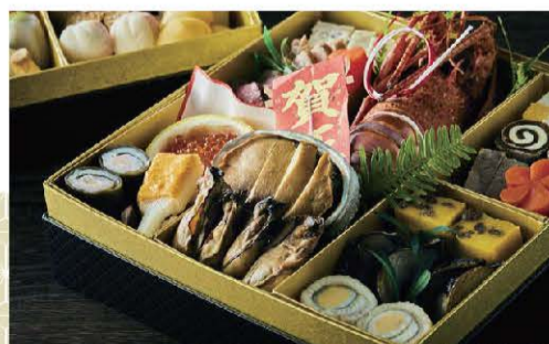
「有もと」厳選おせち二段重

※商品はクール宅急便にて、12月31日(火)までにお届けいたします。※ご予約後のキャンセルは承れません。予めご了承ください。