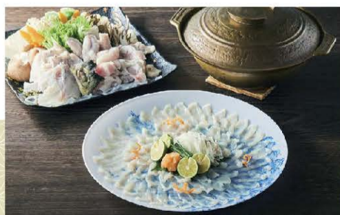
ふく鍋(てっちり)セット